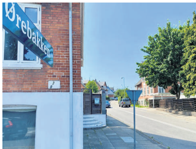
En af de stejle - Ørebakken.