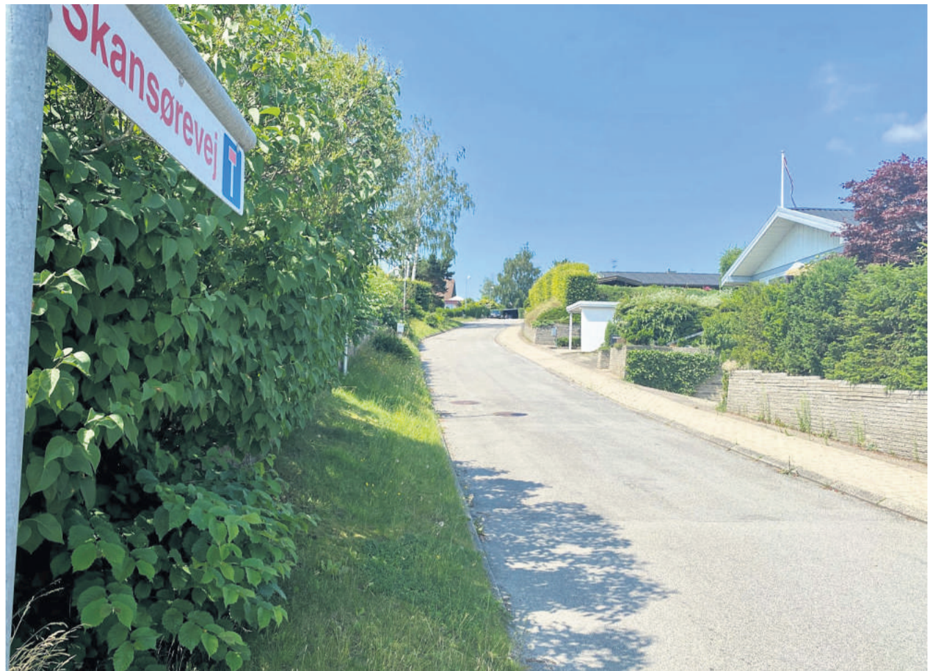
Kort, men meget stejl er Skansørevej.

Men tilbage til fladlandet. Ørebakken fra Marienlyst