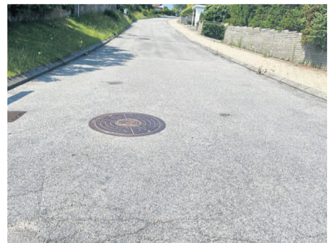
Stejlhed er vanskeligt at give et indtryk af på fotografier, Men her er det begyndelsen af Skansørevej.

Allé i Helsingør stiger med pæne 6,3 procent. Også her er der for nyligt blevet kørt cykelløb. Det skete, da de professionelle kvinder sidste år kørte Helsingør-etapen i det internationale etapeløb, Tour of Scandinavia.