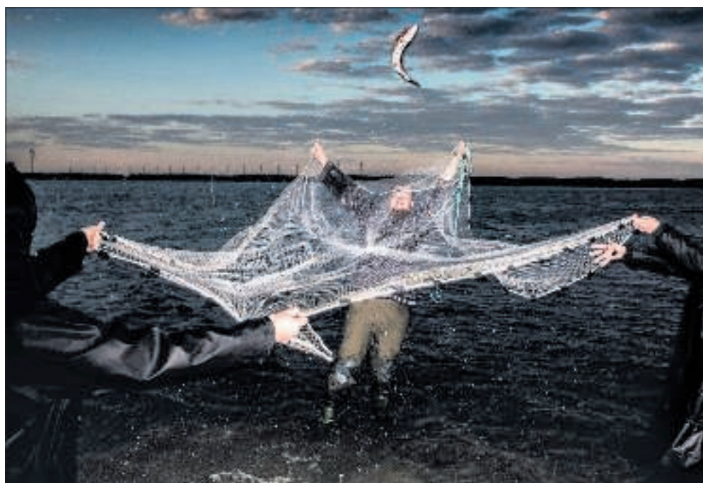
Dance of the Fisherman er en af de forestillinger, som publikum kan glæde sig til.

Imens bliver lokale musikere en del af Basinga Live-Band, der skaber den musikalske dialog med linedanseren, når hun bevæger sig ud i luften mellem bygningerne i boligområdet Nøjsomhed – uden sikring.