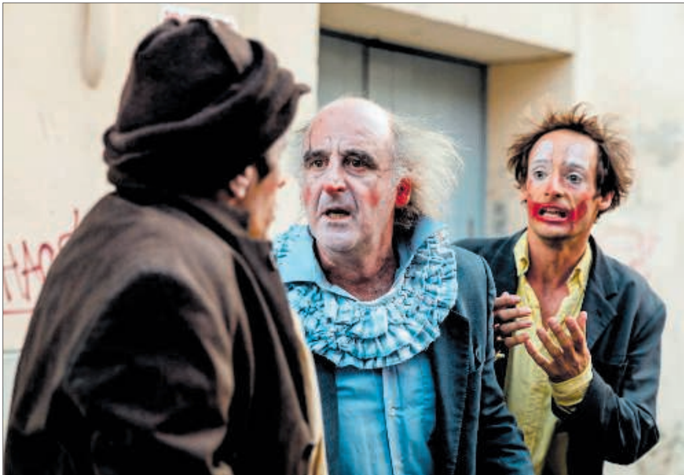
Program og billet salg kan findes via www.passagefestival.nu. Her er det en scene fra "Death from Laughter".