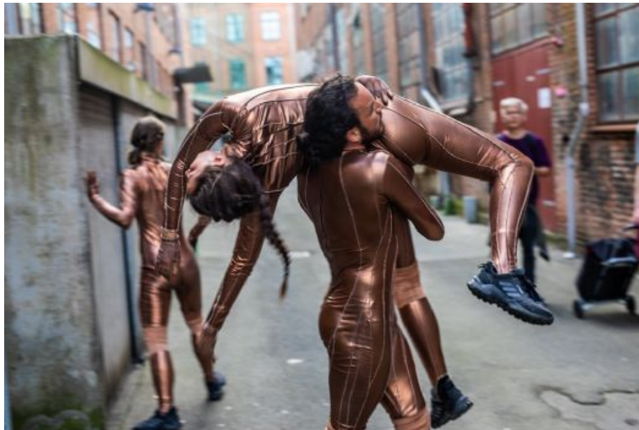
Dansernes flotte kobberfarvede kostumer får dem til at ligne statuer, der bliver levende, i 'Through the Wall' af Thomas Bentin.